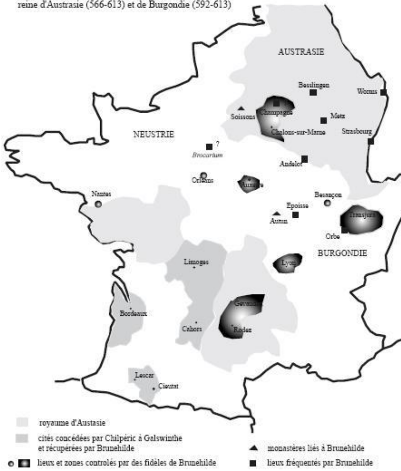
Carte n° 1 : Lieux contrôlés par Brunehilde reine d'Austrasie (566-613) et de Bourgondie (592-613)